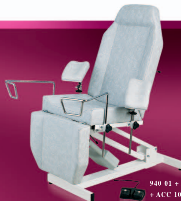
940 01 + ACC537 + ACC 105