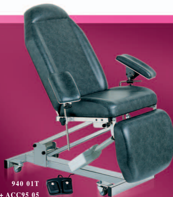
940 01T + ACC95 05