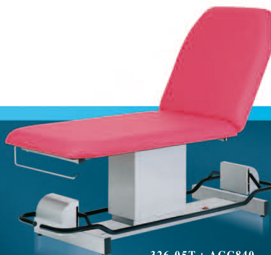
326 05T + ACC840