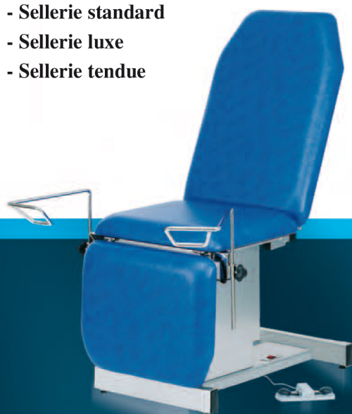
326 08T + ACC76 + ACC105

• Capacité de charge : 130 Kg en dynamique Load capacity: Dynamic 130kg