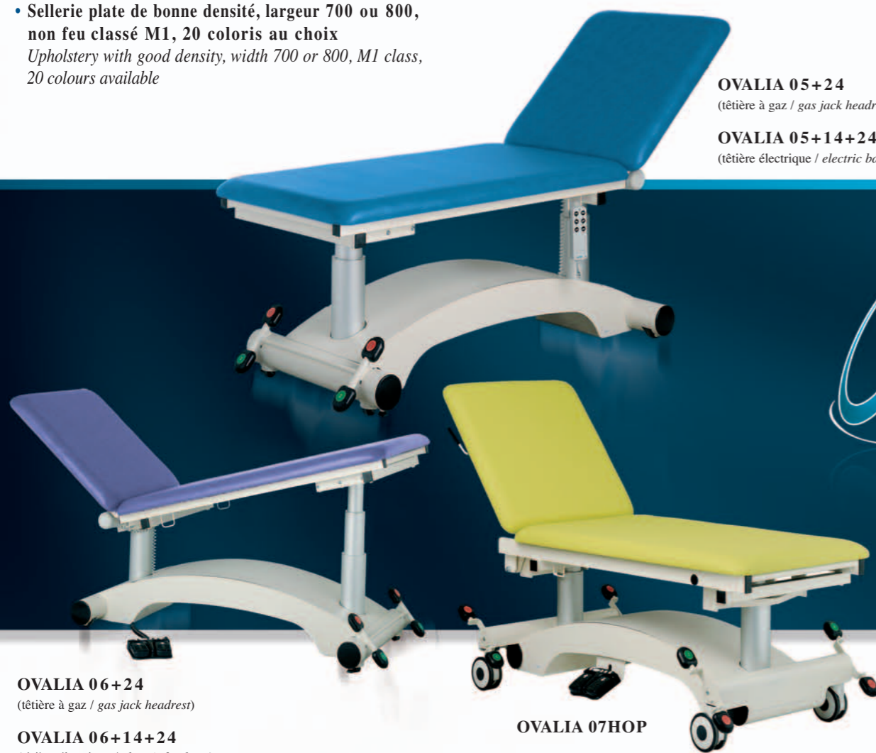
OVALIA 05+24 (tête à gaz / gas jack headrest)