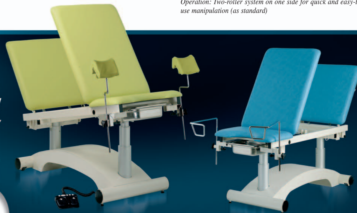
OVALIA 13 + ACC964 + SL964 (Pédale / Pedal)

Tri-function pedal, built-in retractable roller system, pair of clamps, pair of leg-rests, pair of stirrups, blood-test splint, stainless steel accessory rail mount, retractable bed rails, accumulator, 4 directional wheels with brake Ø 125, plastic protection for leg rest