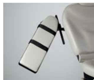
Appui-bras fixe Dimensions : 17,7 cm l x 61 cm L (7" W x 24" L)