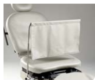
Écran de blocage de la vue