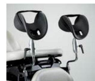
Supports de genoux articulés