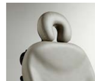
Tête en forme de U Dimensions : 20,3 cm H x 27,9 cm l (8" H x 11" W)