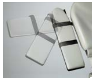
Appui-bras articulé Dimensions : 17,7 cm l x 61 cm L (7" W x 24" L)