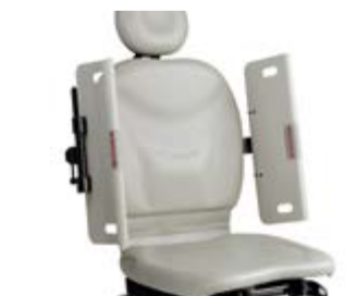
Panneaux latéraux de sécurité