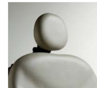
Tête plate Dimensions : 20,3 cm H x 22,8 cm l (8" H x 9" W)