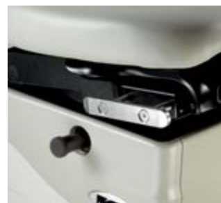
Rails de siège Taille chirurgicale 2,9 cm (1 1/8")