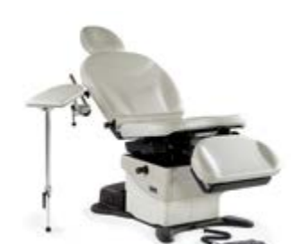
Appui-bras pour chirurgie de la main Dimensions : 21,6 cm l x 66 cm L (8 1/2" W x 26" L)