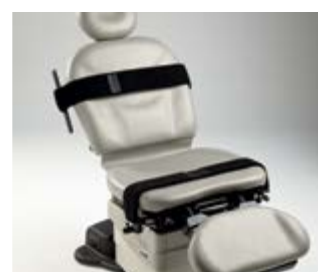
Sangles de sécurité