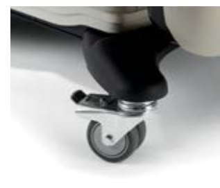
Roulettes de blocage 8,9 cm (3 1/2") de hauteur supplémentaire