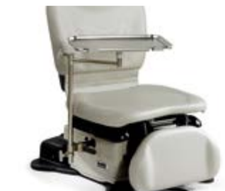
Plateau d'instruments à bras unique