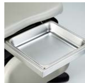
Bac gynécologique Bac gynécologique plus large en option 33 cm l x 30,5 cm L x 6,35 cm P (13" W x 12" L x 2 1/2" D)