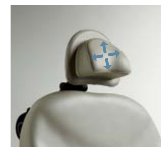
Tête magnétique Dimensions : 20,3 cm H x 25,4 cm l (8" H x 10" W)