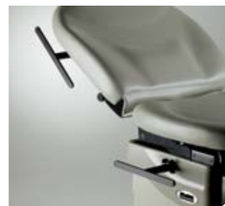
Rails d'accessoires de dossier/de base Taille chirurgicale de 2,9 cm (1 1/8") et taille standard de 2,5 cm (1")