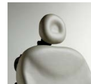
Tête ronde Dimensions : 20,3 cm H x 22,8 cm l (8" H x 9" W)