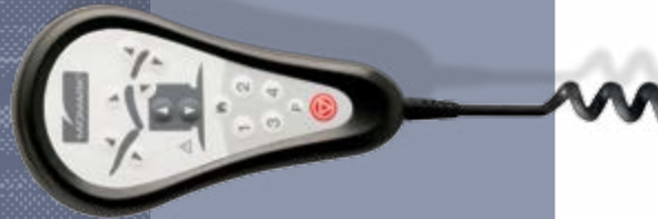
Table d'intervention Midmark HUMANFORM™