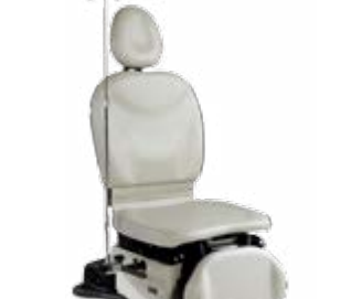
Potence à perfusion