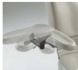
Bras de fauteuil pivotants Disponibles pour les largeurs de garniture de 71,1 cm et 81,3 cm (28" et 32")

Un positionnement précis et un plus grand confort signifient que les patients sont soutenus là où ils en ont le plus besoin.