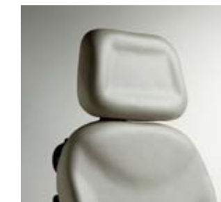
Tête rectangulaire Dimensions : 30,5 cm H x 45,7 cm l (12" H x 18" W)