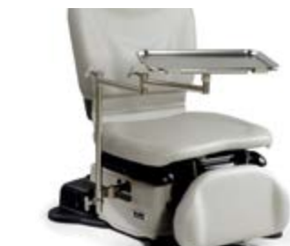
Plateau d'instruments à bras double